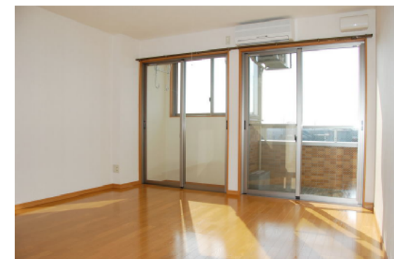
Cタイプ洋室 (Dタイプも同じ)