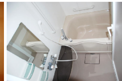
Cタイプ浴室 (Dタイプも同じ)