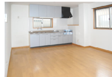
AタイプDK (Bタイプも同じ)