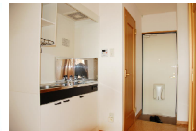
CタイプDK (Dタイプも同じ)