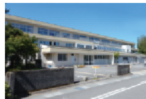
グリーンセンター