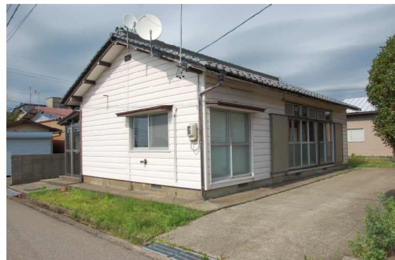
多少の修繕により住宅として使用できる建物です。