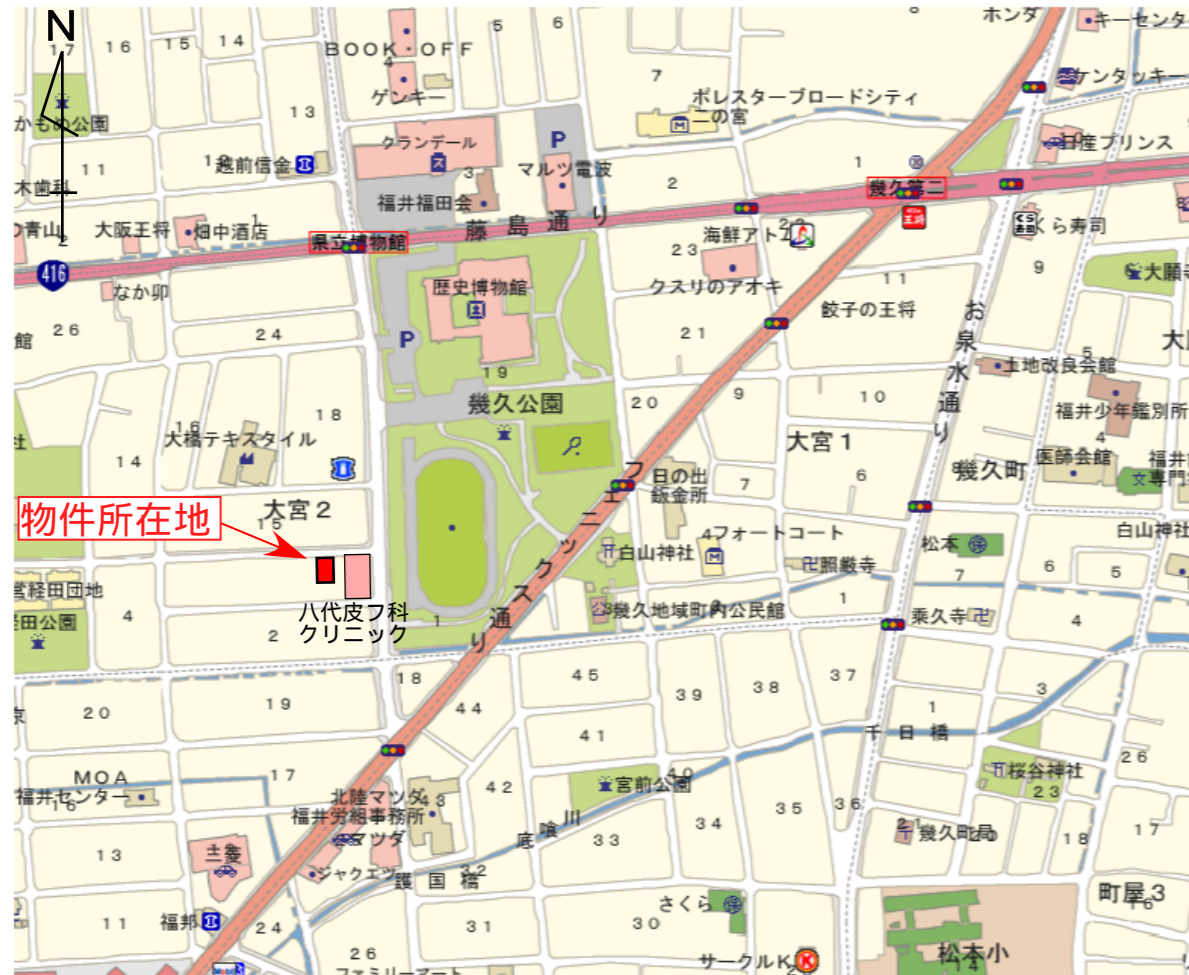
幾久公園西側 八代皮フ科クリニックの裏